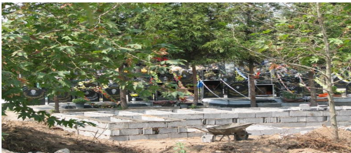
↑☺ قبرهای انفرادی جدید که بر روی محل احتمالی گورهای جمعی در گورستان تازه‌آباد ساخته می‌شوند.