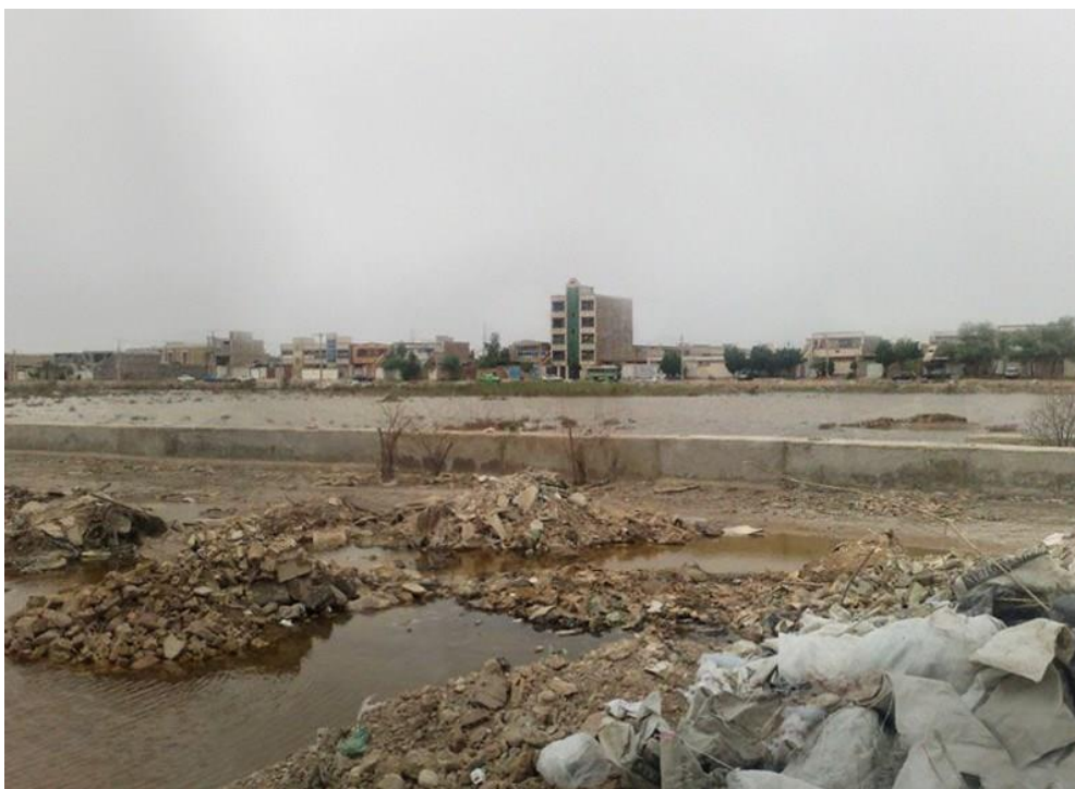
↑⊗ تصویر یک گور جمعی در قطعه زمینی بایر در ۳ کیلومتری شرق گورستان بهشت‌آباد اهواز. تصویر می‌شود که بازمانده اجساد زیر سطح بتنی قابل مشاهده در تصویر قرار گرفته باشند.

طی سال‌های بعد، مقامات پیوسته به شیوه‌های گوناگون به این محل بی‌حرمتی کرده‌اند، از جمله با تبدیل کردن آن به محل انباشت زباله و منع کردن خانواده‌ها از تجمع و برگزاری مراسم نکوداشت و تزیین محل با عکس، گل و پیام‌های یادبود. عکس‌های گرفته شده از این محل در سال ۱۳۹۰ توده‌های زباله‌ای را نشان می‌دهد که خانواده‌ها برای رسیدن به آرامگاه عزیزانشان مجبورند از میان آنها عبور کنند.