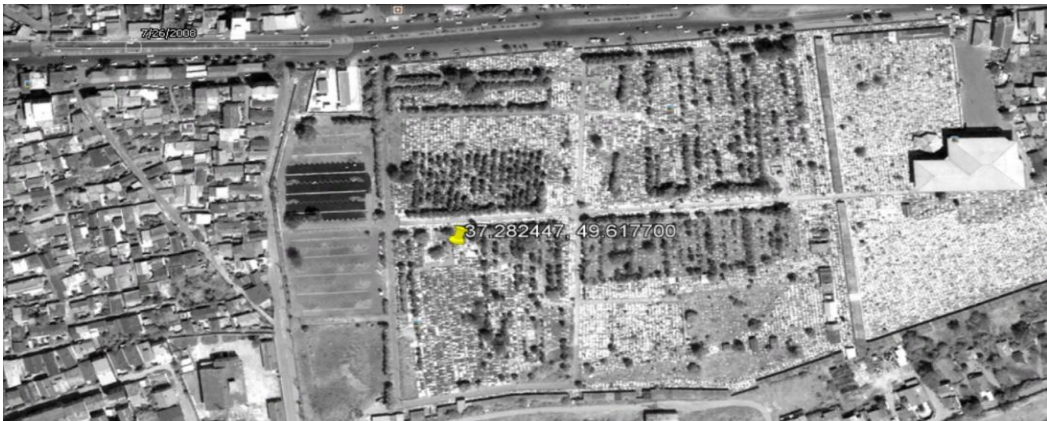
↑⊗ این تصویر ماهواره‌ای که در سال ۱۳۸۷ گرفته شده است نشان‌دهنده آثار ساخت‌وساز در محل احتمالی گوری دسته‌جمعی در گورستان تازه‌آباد است.