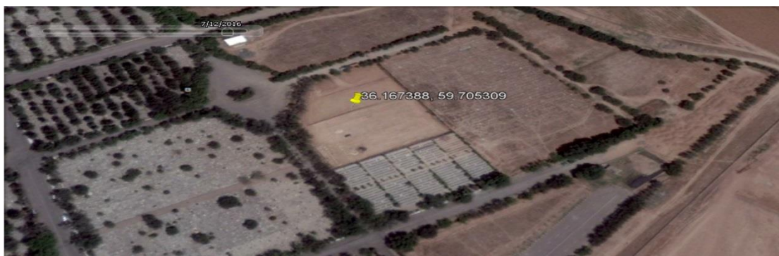
این تصویر در تاریخ ۲۲ تیر ۱۳۹۵ بوسیله ماهواره گرفته شده است و نشان می دهد که رنگ بخشی از محل احتمالی گور جمعی واقع در گوشه جنوب شرقی گورستان بهشت رضا تغییر کرده است. به نظر می رسد که این تغییر در نتیجه انباشت خاک جدید در محل ایجاد شده باشد.