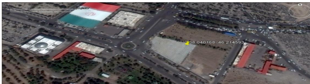
تصویر ماهواره‌ای به تاریخ ۲۰ مرداد ۹۶ پیشرفت ساخت و سازها را در محل گور جمعی احتمالی در قبرستان وادی رحمت نشان می‌دهد.