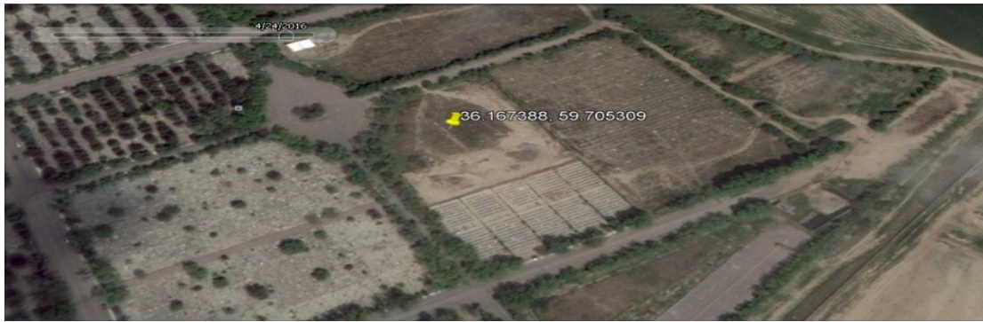
این تصویر در تاریخ ۵ اردیبهشت ۱۳۹۵ به وسیله ماهواره گرفته شده است و وضعیت گور جمعی احتمالی واقع در گوشه جنوب شرقی گورستان بهشت رضا را قبل از آغاز ساخت و سازها نشان می دهد.