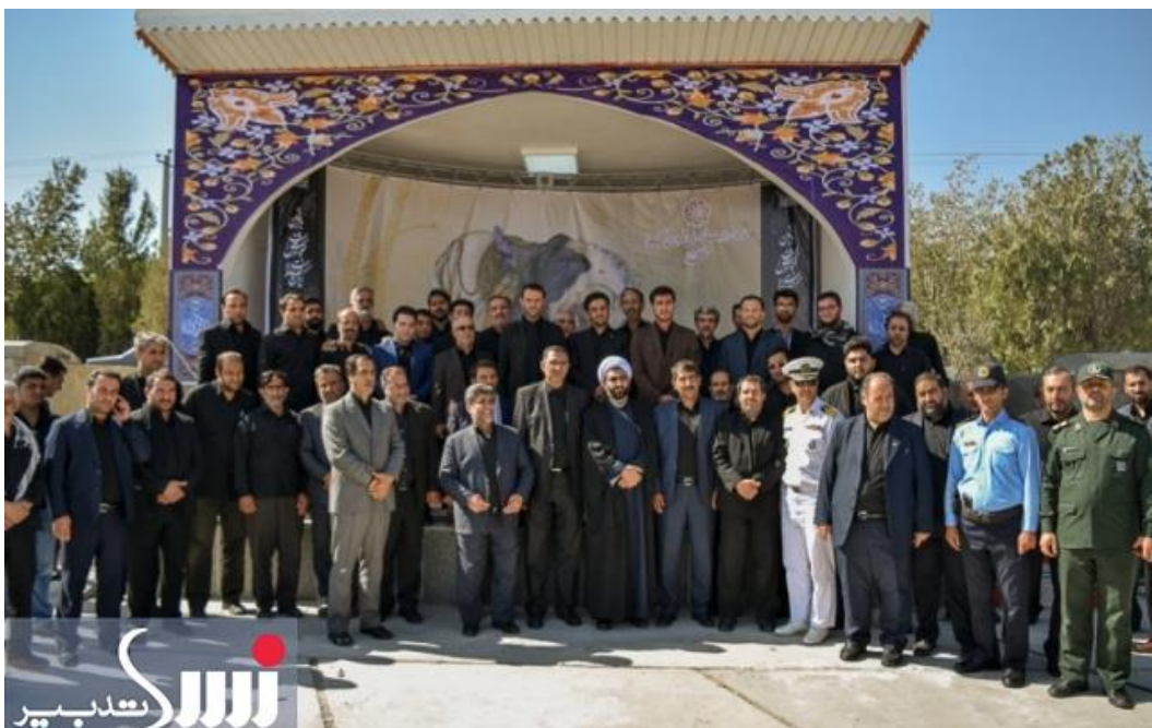
↑ © این عکس در سایتهای خبری رسمی منتشر شده، خبر از گشایش رسمی جایگاه ویژه برگزاری مراسم رسمی در گورستان وادی رحمت می‌دهد. در این گزارشها اشاره نشده است که جایگاه مذکور بر روی یک گور جمعی احتمالی ساخته شده است.