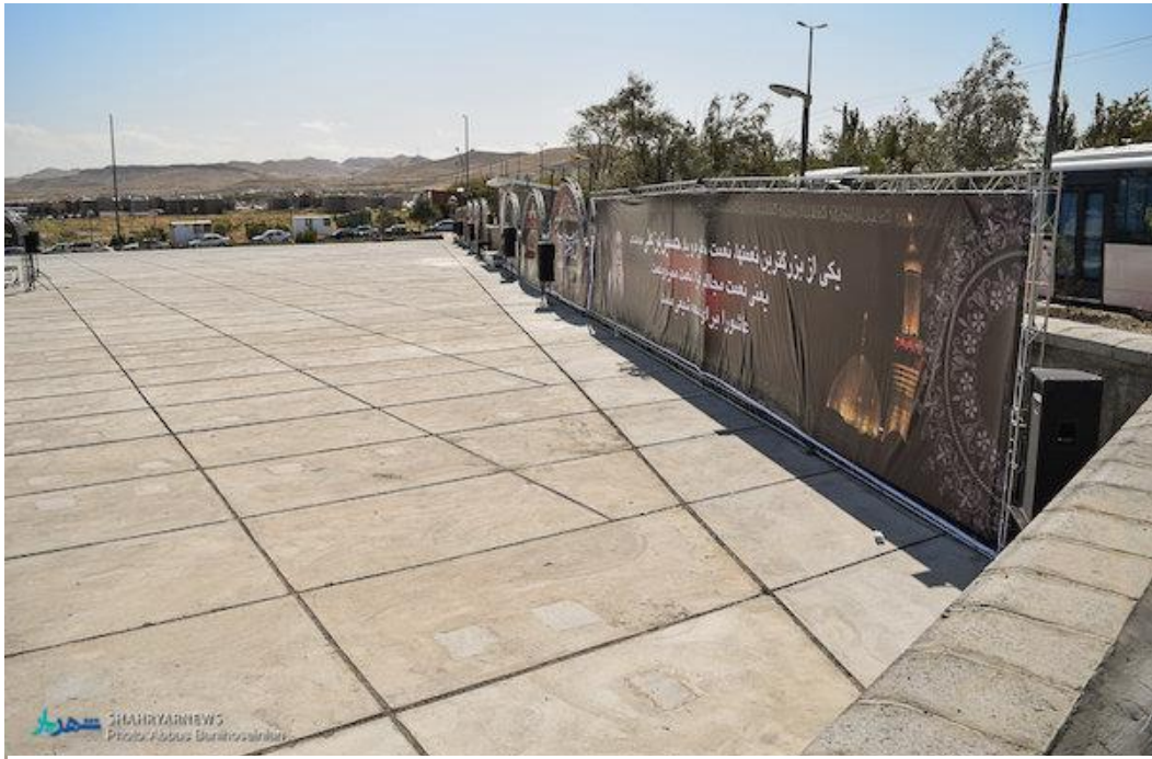
↑ © این تصویر در سایتهای خبری رسمی ایران منتشر شده است و خبر از اتمام ساخت جایگاه برگزاری مراسم رسمی در قبرستان وادی رحمت می‌دهد. در این خبرها اشاره نشده است که جایگاه مذکور بر روی یک گور جمعی احتمالی ساخته شده است.