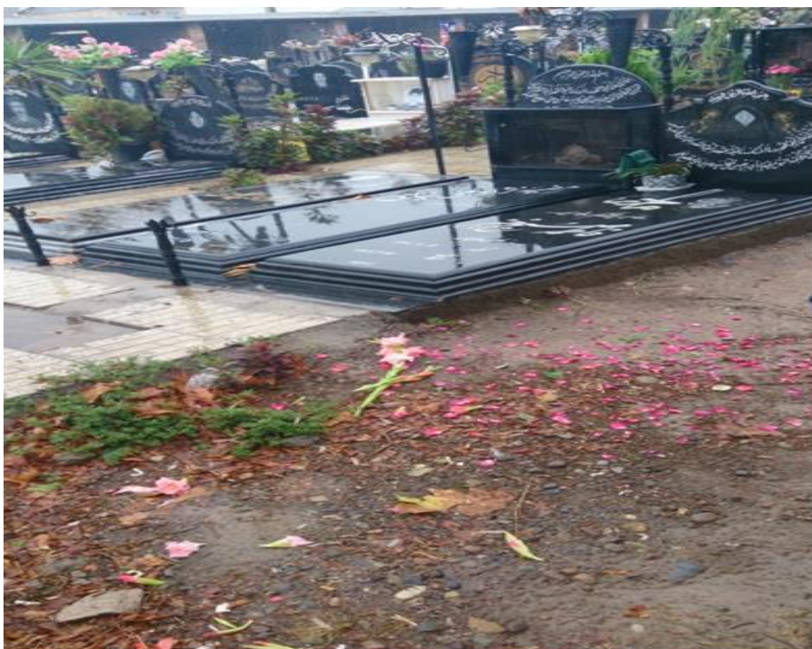
↑☺ سنگ قبرهایی که بر روی گورهای جدید در گورستان تازه‌آباد نصب شده است.