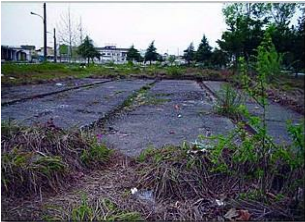
↑ © تصویر گور جمعی احتمالی در قبرستان تازه آباد قبل از آغاز تخریب در سال ۱۳۸۷ © پیش‌تازان راه آزادی

یکی از اعضای خانواده‌های قربانیان با تعدادی از کسانی که قبرهای جدید را خریده‌اند صحبت کرده است. طبق گفته او در مصاحبه با عدالت برای ایران، این افراد همگی اظهار داشته‌اند که مقامات چیزی به آنها درباره وجود گورهای جمعی در زیر این قبرها نگفته بودند.