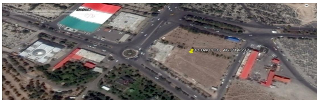
این تصویر ماهواره‌ای که در تاریخ ۷ تیر ۱۳۹۶ گرفته شده است، وضعیت گور جمعی احتمالی در قبرستان وادی رحمت را اندکی بعد از آغاز عملیات ساخت و ساز نشان می‌دهد.