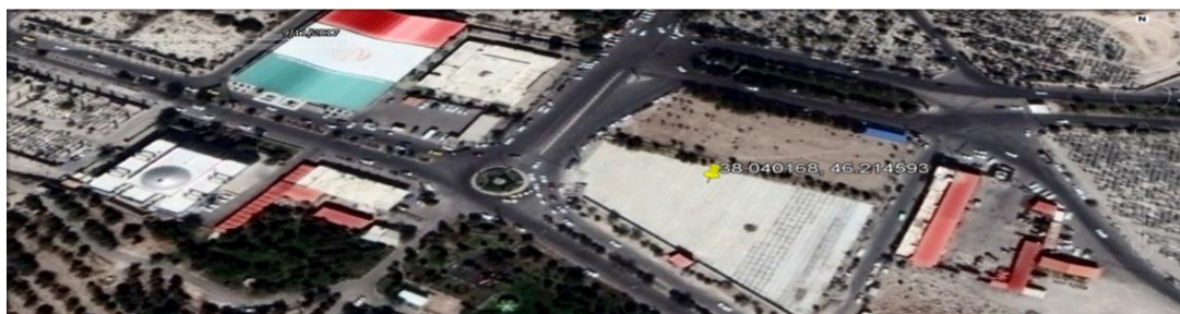
این تصویر ماهواره‌ای که در تاریخ ۲۰ شهریور ۱۳۹۶ گرفته شده نشان می‌دهد که بیش از نیمی از سطح گور جمعی احتمالی در قبرستان وادی رحمت با بتن پوشانیده شده است.