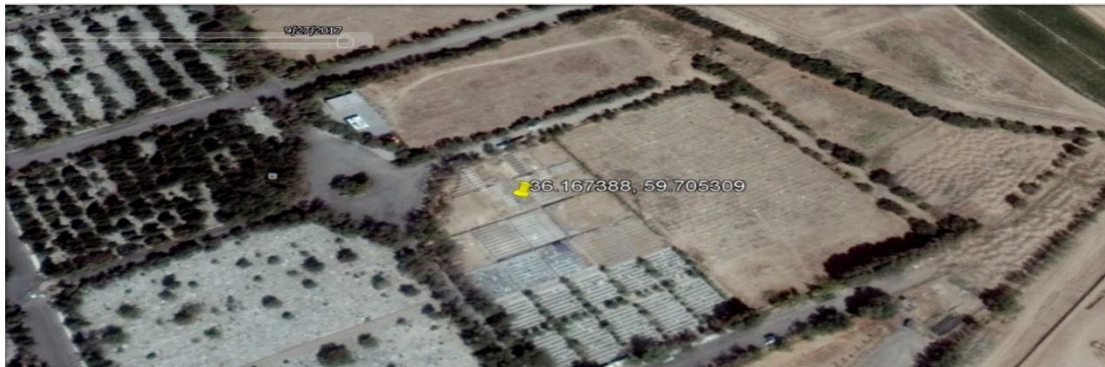
این تصویر در تاریخ ۵ مهر ۱۳۹۶ بوسیله ماهواره گرفته شده است و نشان می دهد که بخشی از محل احتمالی گور جمعی واقع در گوشه جنوب شرقی گورستان بهشت رضا با آنچه به ظاهر قبرهای جدید می رسد پوشانده شده است.