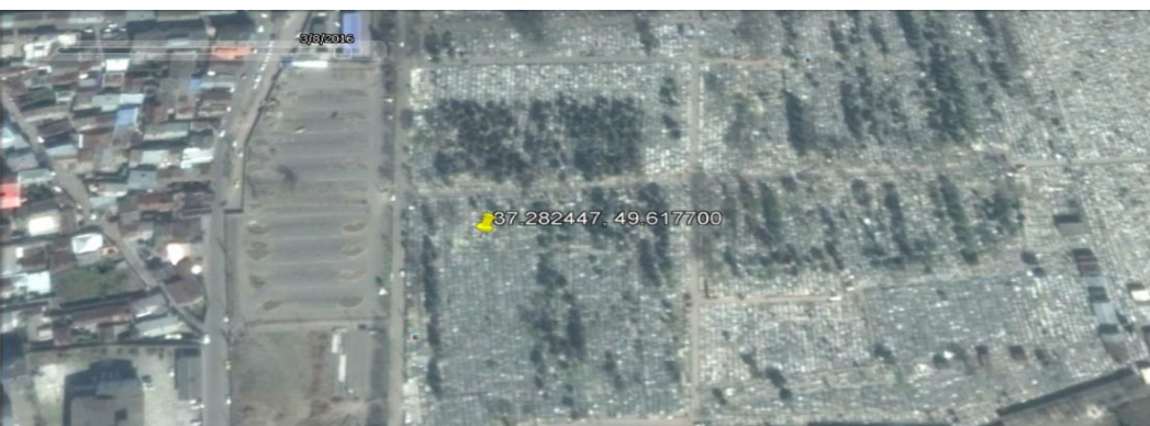
↑⊗ این تصویر ماهواره‌ای که در سال ۱۳۹۴ گرفته شده است نشان می‌دهد محل احتمالی گور جمعی در قبرستان تازه‌آباد که قبلاً مسطح بوده است اکنون با قبرهای انفرادی جدید پوشیده شده است.