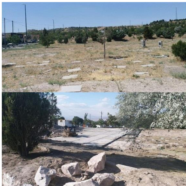
↑⊗ محل گور جمعی احتمالی در قبرستان وادی رحمت، قبل و بعد از تخریب در سال ۱۳۹۶.

بر اساس گزارش رسانه‌های محلی، در خرداد ماه ۹۶ سازمان آرامستان‌های شهرستان تبریز که مسئول نظارت بر قبرستان‌های شهر است، پروژه‌ای را برای تبدیل این منطقه به جایگاه برگزاری مراسم آغاز کرد. ۹ از آن زمان به بعد مسئولان بر روی بیش از نیمی از این منطقه بتن پاشیده‌اند. تصاویر و عکس‌های ماهواره‌ای که عفو بین‌الملل و عدالت برای ایران به دست آورده‌اند، تأییدکننده تغییرات زیادی است که در این منطقه در فاصله زمانی خرداد ۹۶ تا پایان پروژه ساخت و ساز در شهریور ۹۶ اتفاق افتاده است.