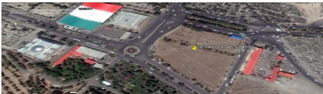
این تصویر که در تاریخ ۱۹ خرداد ۱۳۹۶ بوسیله ماهواره گرفته شده است، وضعیت گور جمعی احتمالی در قبرستان وادی رحمت را پیش از تخریب نشان می‌دهد.