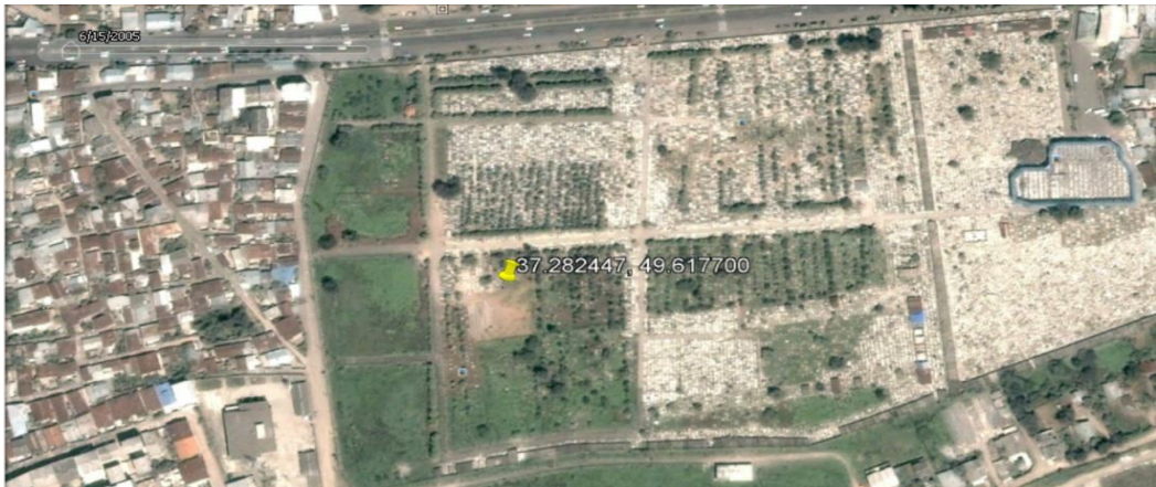
↑⊗ این تصویر ماهواره‌ای در سال ۱۳۸۴ گرفته شده است و محل احتمالی گور جمعی در قبرستان تازه‌آباد را نشان می‌دهد. این محل با پونز زردرنگ در تصویر مشخص شده است.